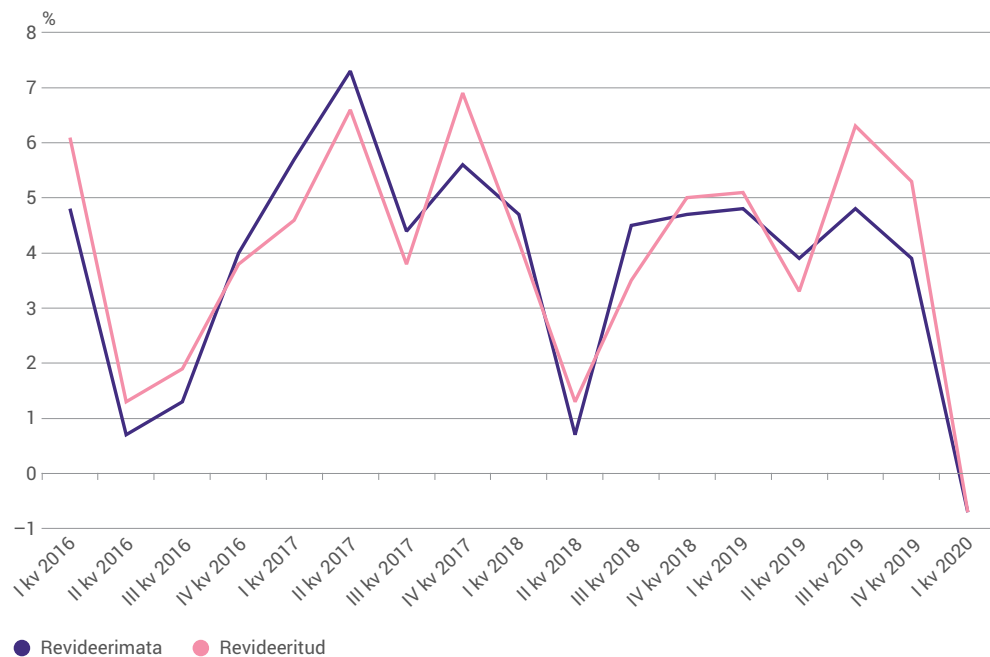
Joonis 2. SKP reaalkasv võrreldes eelmise aasta sama perioodiga enne ja pärast revideerimist, esimene kvartal 2016 kuni esimene kvartal 2020

Kokkuvõttes vähendas 2016. aasta pakkumise ja kasutamise tabelite kasutuselevõtt mõningal määral järgneva aasta iga kvartali SKP kasvu. Kasutusele võetud uued andmeallikad 2018. aasta kohta aga kiirendasid eelkõige 2019. aasta teise poolaasta kasvutemposid.