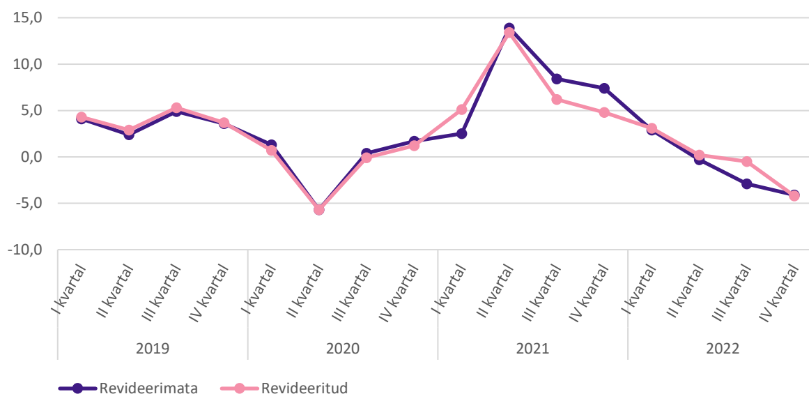
Joonis 2. SKP reaalkasv võrreldes eelmise aasta sama perioodiga enne ja pärast revideerimist, I kvartal 2019 – IV kvartal 2022

Kokkuvõttes vähendas 2019. aasta pakkumise ja kasutamise tabelite kasutuselevõtt nii selle kui ka järgneva aasta SKP-d. Revisjoni suuremad korrektsioonid tulid aga 2021. aasta kohta kasutusele võetud uutest andmeallikatest. Ka 2022. aasta numbrid täpsustusid oluliselt. Kuigi majanduse üldisi trende revisjon ei muutnud, siis täpsustused tulid viimaste aastate majanduse struktuuri. Peamise muutusena hinnati väiksemaks info ja side tegevusala mõju viimaste aastate majandusse. 2021. aasta täpsustuste mõjul oli korrektsioone ka SKP kvartaalses käitumises. (vt. joonis 2)